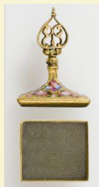
Talisman safavide inscrit sur pierre